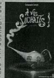
La Cie Songes nous invite à un voyage en caravane où les objets prennent vie.

Atelier théâtre: Un atelier de théâtre sera proposé aux jeunes des différentes troupes de théâtre amateur de Tournon. Le travail s'articulera autour du spectacle pour le jeune public autour du texte Son parfum d'avant-lanche de Dominique Paquet. Présentation des travaux. MJC de Tain: samedi 3 novembre à 19h. Entrée gratuite.