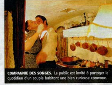
COMPAGNIE DES SONGES. Le public est invité à partager le quotidien d'un couple habitant une bien curieuse caravane.