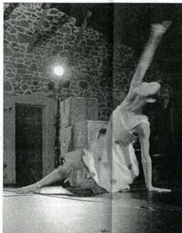
La Cie 158 propose une danse autour des sens, un spectacle pour les enfants dès 4 ans.

Ce festival se veut une nouvelle fois pluridisciplinaire (théâtre, danse, musique) afin de faire découvrir aux enfants et leurs parents toute la richesse de la création contemporaine pour petits et grands.