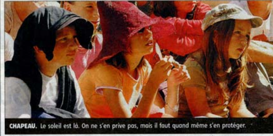
CHAPEAU. Le soleil est là. On ne s'en prive pas, mais il faut quand même s'en protéger.

Des personnes probablement à la recherche d'un abri pour passer la nuit orageuse ont eu l'inspiration de donner rendez-vous à Morphée au creux d'une poubelle municipale. Nul ne sait si les éboueurs leur ont apporté le petit-déjeuner. ■